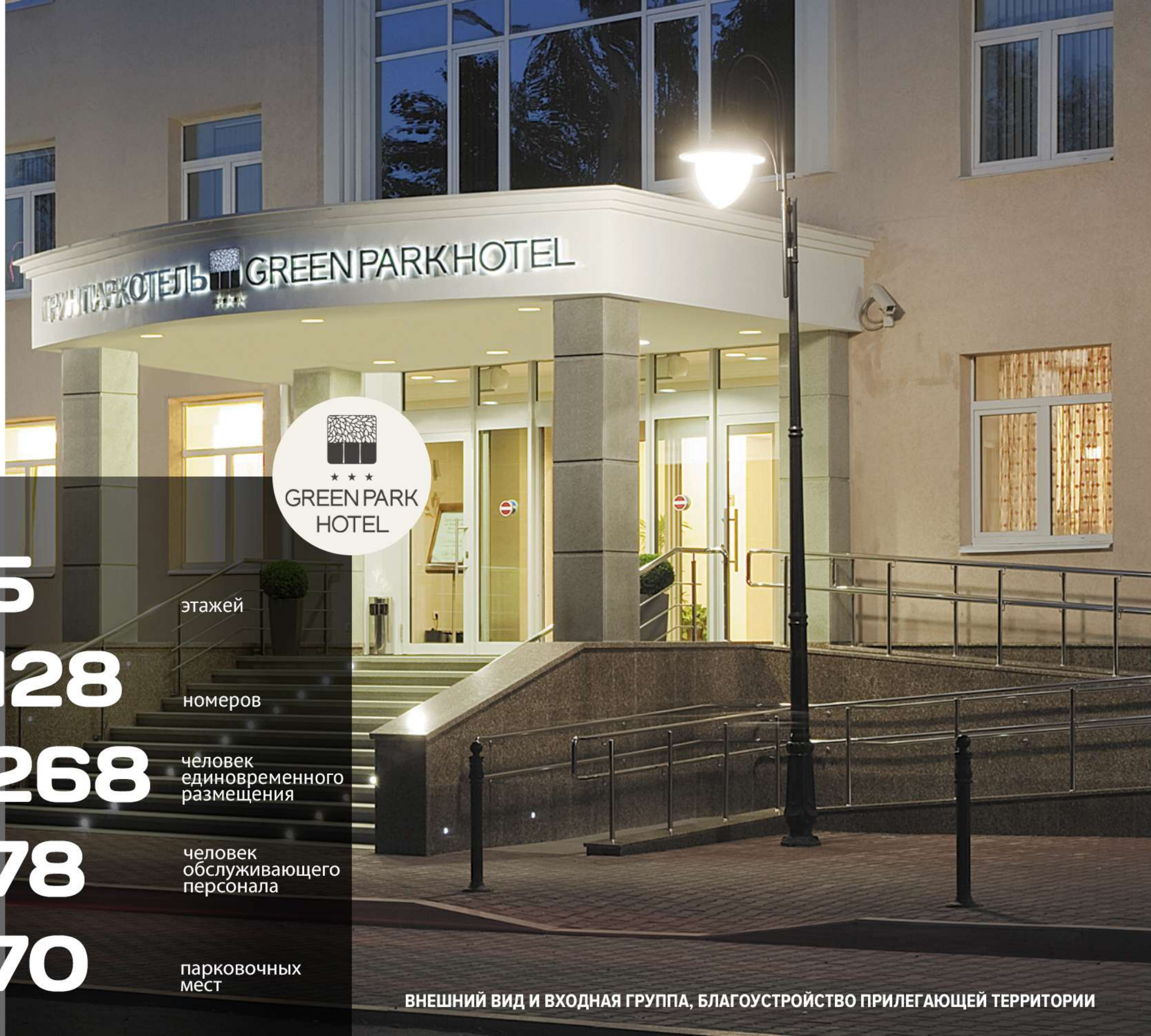
ВНЕШНИЙ ВИД И ВХОДНАЯ ГРУППА, БЛАГОУСТРОЙСТВО ПРИЛЕГАЮЩЕЙ ТЕРРИТОРИИ